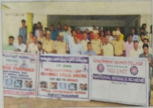
మాట్లాడుతున్న అసిస్టెంట్ కమిషనర్ మధుమోహన్ రావు