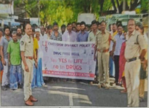
పాఠశాలముద్రం : బరిజకండ్లగిరి ర్యాలీ